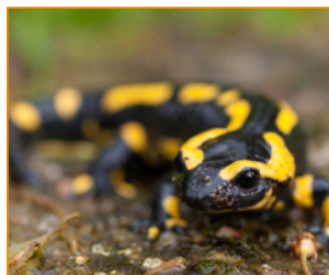
P 25 RONSESE VUUR- SALAMANDER KRIJGT EUROPESE STEUN