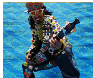
P 13 GNAWA-MUZIEK IN CC DE VERVERIJ