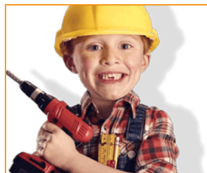
P 8 OPEN WERVEN DAG