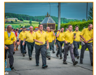
P 14 FIERTELOMMEGANG 2019