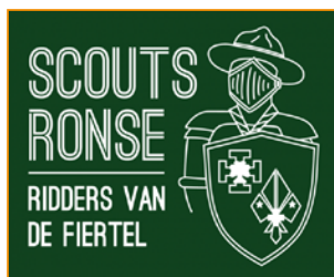
P 4 JUBILEUM RIDDELS VAN DE FIERTEL