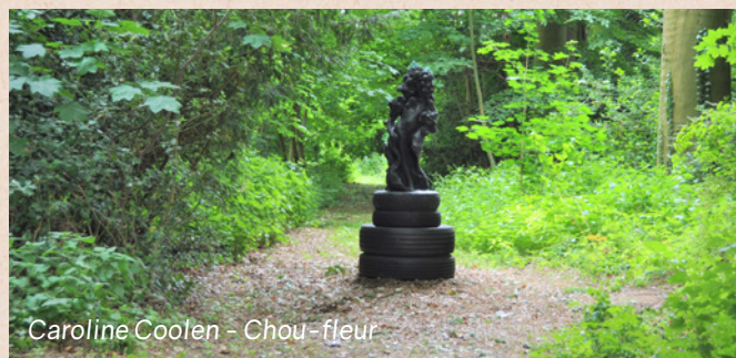
Caroline Coolen - Chou-fleur